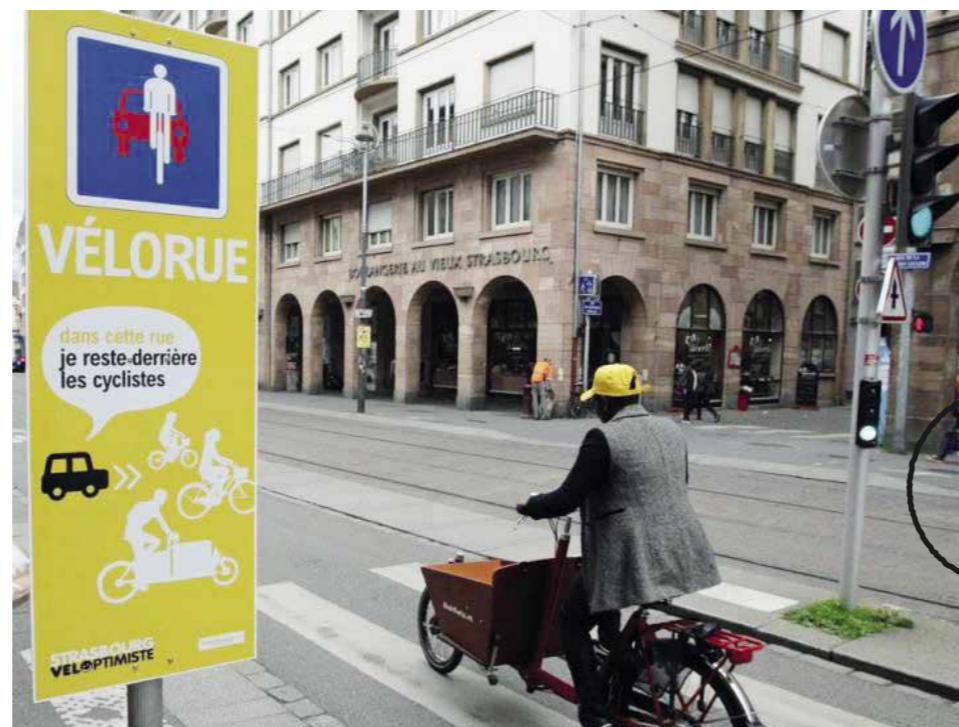
Exemple de vélorue à Strasbourg

De nouveaux cheminements piétons et la piétonisation de certaines rues ont été préconisés.