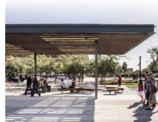
Illustration à titre d'exemple de halle ouverte

Les axes proposés par les participants pour décliner cette orientation se sont concentrés sur les secteurs de la Picoterie et Tertifume