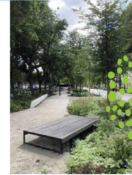
Illustration à titre d'exemple de jardin