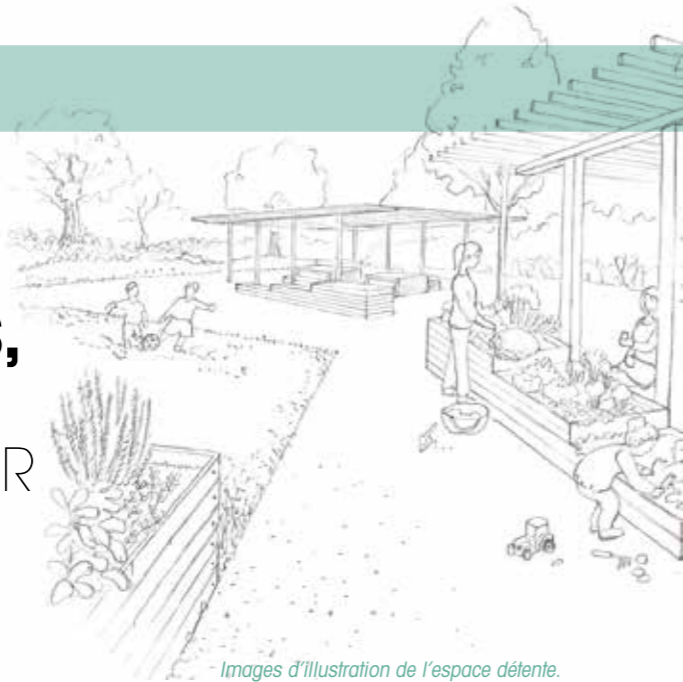
Images d'illustration de l'espace détente.

Après les travaux sur la coulée verte et l'aire de jeux réalisés en 2015 et 2016, une seconde phase d'aménagement des espaces publics verra le jour pour une livraison au printemps 2023.