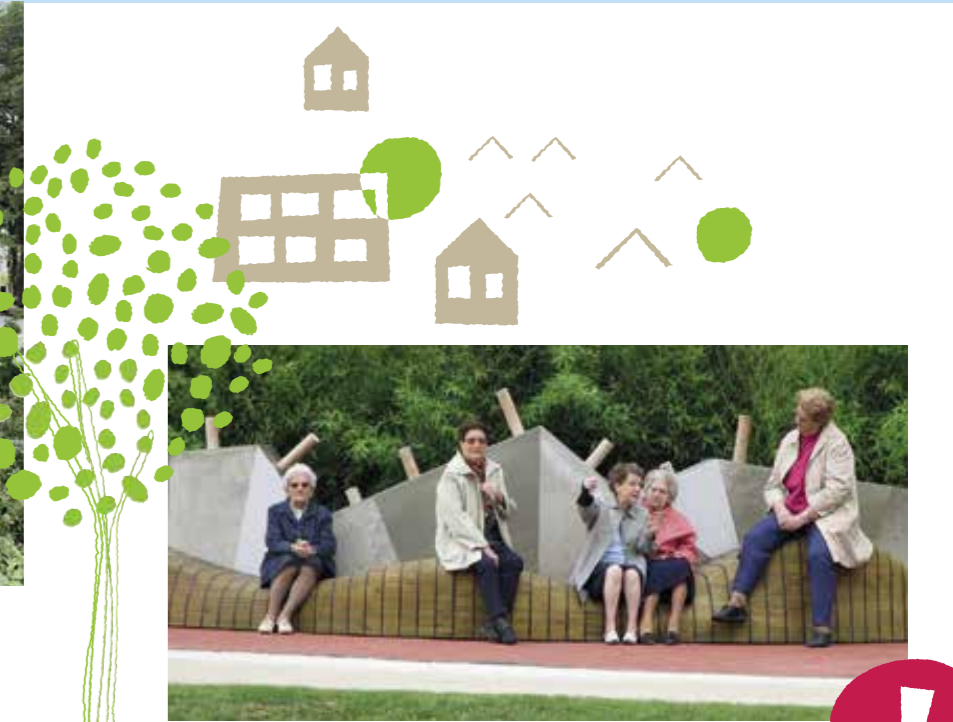
Illustration à titre d'exemple d'espace intergénérationnel