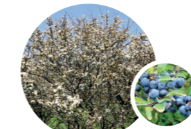
PRUNUS SPINOSA / PRUNELLIER