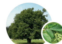
CARPINUS BETULUS / CHARME