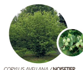
CORYLUS AVELLANA / NOISETIER