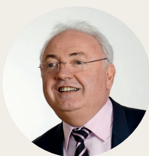
Didier ROISNÉ Maire de Beaucouzé

Le projet bas carbone a pour objectif de dépasser le niveau d'exigence réglementaire en atteignant des niveaux élevés de sobriété énergétique et de réduction des gaz à effet de serre. Mené conjointement avec un programme de recherche, il nous offre l'opportunité de faire de Beaucouzé un laboratoire environnemental dont les expérimentations profiteront à notre commune et permettront de faire progresser les réglementations thermiques à l'échelle nationale. Pour tous-habitants, acteurs économiques, promoteurs privés ou bailleurs sociaux - cette démarche se veut non seulement innovante, mais aussi attractive... Il s'agit en effet de construire la commune de demain!