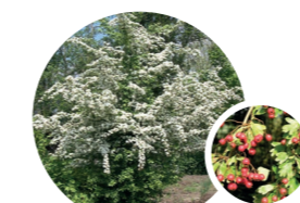
CRATAEGUS MONOGYNA / AUBÉPINE