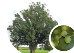
QUERCUS ROBUR / CHÊNE PÉDONCULÉ