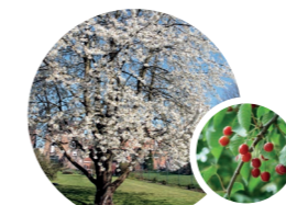
PRUNUS AVIUM / MERISIER