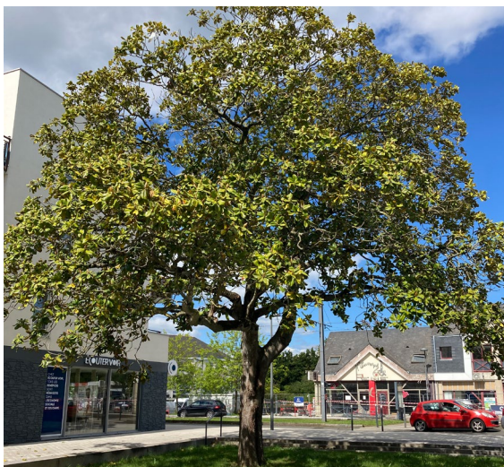
Le Magnolia conservé

Après la réalisation de la place Jacques Chirac, de l'Espace de Santé et la déconstruction de l'îlot des banques, de l'ancien immeuble Podeliha, et des 10 au 14 rue Schwëitzer, le moment venu de dévoiler le cœur de ville tel qu'il va se transformer dans les deux ans à venir.