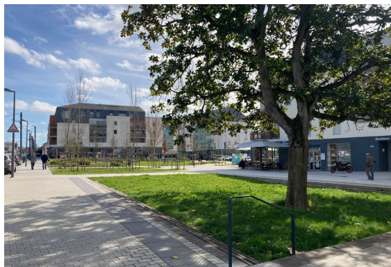
Place Jacques Chirac

Vice-présidente d'Angers Loire Métropole | Maire d'Avrillé