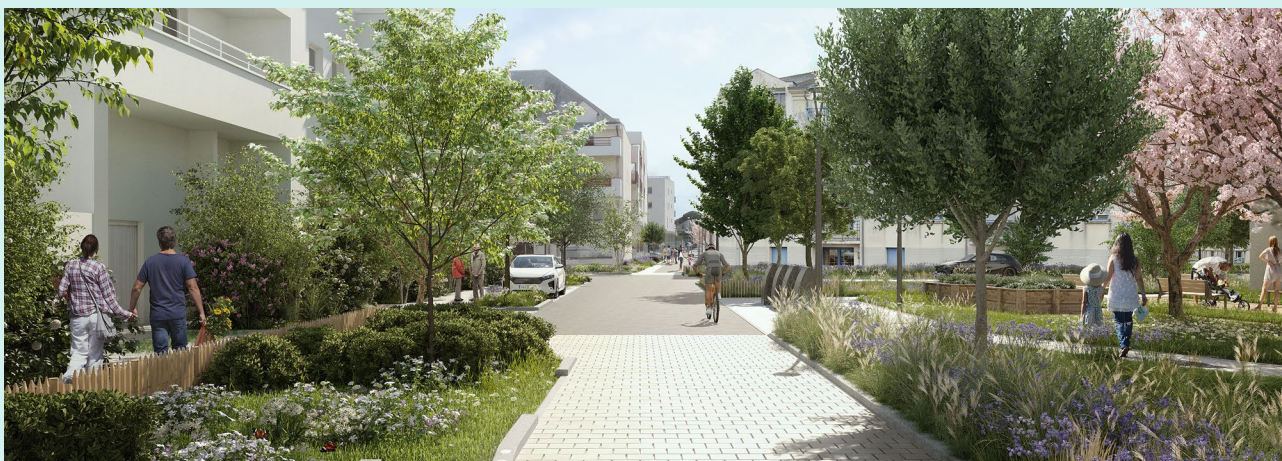
Perspective future rue Amiral Nouvel de la Flèche (photo non contractuelle)

Investissement essentiel pour demain, la végétalisation du cœur de ville permettra de créer un environnement plus sain, plus agréable et plus durable, répondant aux défis environnementaux et sociaux actuels.