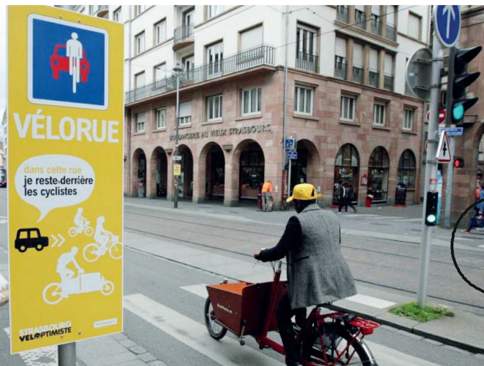
Exemple de vélorue à Strasbourg