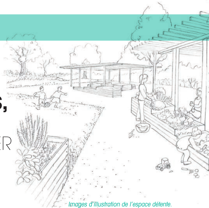
Images d'illustration de l'espace détente.

Après les travaux sur la coulée verte et l'aire de jeux réalisés en 2015 et 2016, une seconde phase d'aménagement des espaces publics verra le jour pour une livraison au printemps 2023.