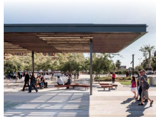
Illustration à titre d'exemple de halle ouverte

Les axes proposés par les participants pour décliner cette orientation se sont concentrés sur les secteurs de la Picoterie et Tertifume