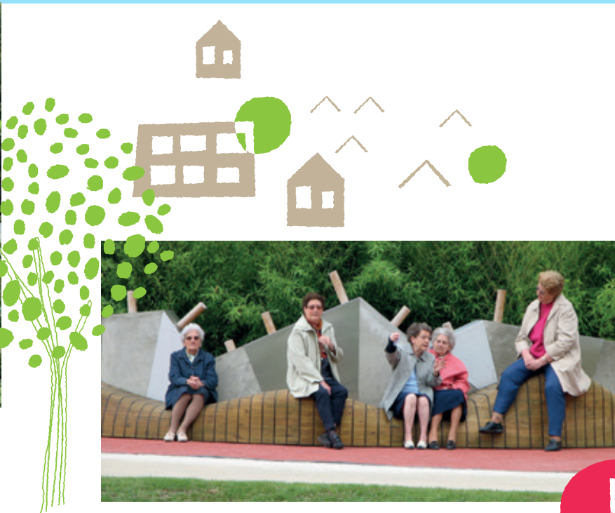
Illustration à titre d'exemple d'espace intergénérationnel