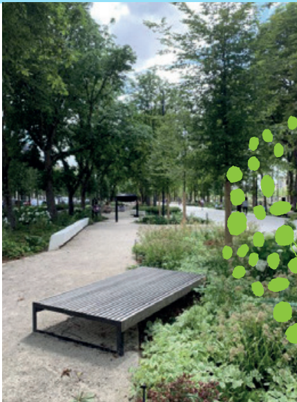
Illustration à titre d'exemple de jardin