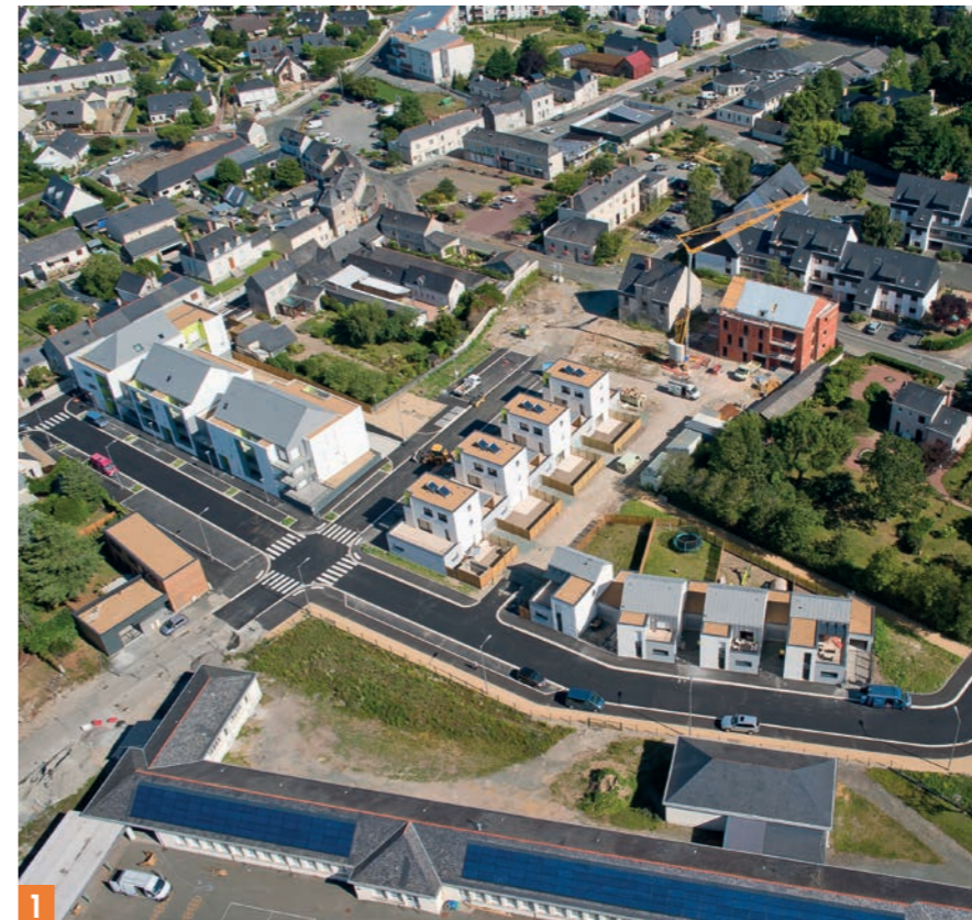
1/ Vue aérienne du secteur en 2012 2/ La nouvelle annexe de la mairie 3/ Réaménagement de l'espace public urbain 4/ Les travaux engagés en 2014 sont aujourd'hui terminés 5/ Programme Veillère 6/ Espace Victor Hugo