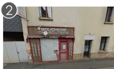
2 l'ex-boucherie 138 rue Albert Pottier