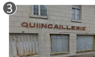
3 l'ex-quincaillerie 5 rue du Prieuré