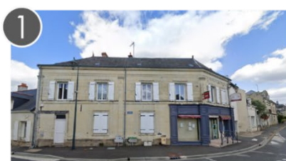
1 l'ex-boulangerie au 180 rue Albert Pottier

Finalisation des études en cours - Démarrage des travaux attendu en 2024