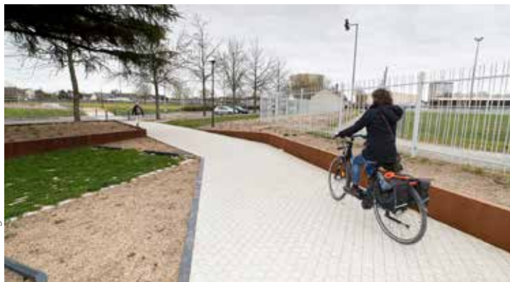
L'aménagement piétonnier et cyclable du chemin du Petit-Bonheur, réalisé en août 2020.

En décembre, Belle-Beille et Monplaisir se sont vu attribuer, par le ministère de la Transition écologique et de la Cohésion des territoires, le label ÉcoQuartier étape n°2, qui récompense la réalisation, par les collectivités, d'opérations exemplaires d'aménagement durable des territoires.