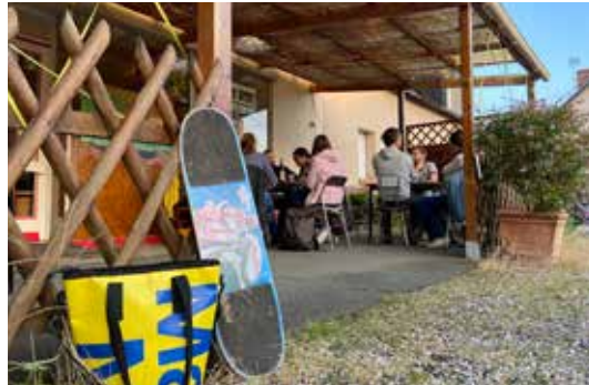
Benoit Akkaoui - ass, La Ruche de Belle-Beille