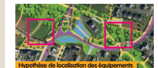
Hypothèse de localisation des équipements

Vous avez un projet, une idée pour favoriser l'échange, la convivialité dans le quartier et répondre à des besoins identifiés (bourse d'échanges, prêt de matériel, jardinage, soutien scolaire...) ? Faites vous connaître auprès du Service Urbanisme.