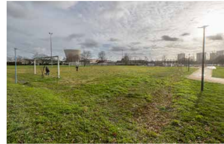
Le long de la rue de la Lande, les terrains actuels seront aménagés en un véritable espace de loisirs avec aires de jeux et de sport en accès libre.

En avril, les engins de chantier investiront les terrains « de pratiques sportives informelles », rue de la Lande. Juste derrière la place Beaussier et face au stade Paul-Robin. Il s'agira de concrétiser les réflexions menées notamment avec les riverains, pour faire du site une véritable zone de loisirs intergénérationnels. Ainsi, les espaces existants seront bientôt remodelés avec la création d'un plateau multisport bordé d'une plaine sportive, d'un city-stade clos et d'une aire de jeux pour enfants. Cette nouvelle base de loisirs rassemblera le quartier autour