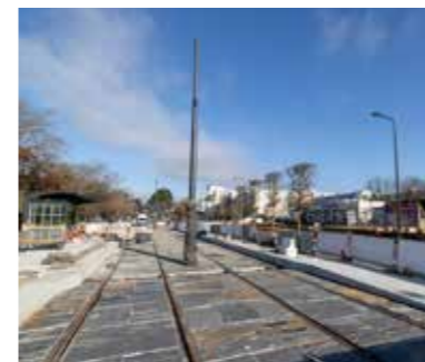
Sur les boulevards Beaussier et Lakanal, les derniers travaux du tramway qui concernent l'équipement des stations, se termineront en juin. Cet été, la place Beaussier devrait donc être libérée des travaux.

D'ici à l'été, les travaux se poursuivent pour déconstruire l'ancienne galerie commerciale, aménager un parvis piétonnier et un parking de 52 places. Aux abords, le carrefour entre le boulevard Beaussier et la rue de la Lande seront refaits à neuf. Une inauguration de la nouvelle place pourra avoir lieu en juin. La dernière étape sera la mise en service du tram en 2023.