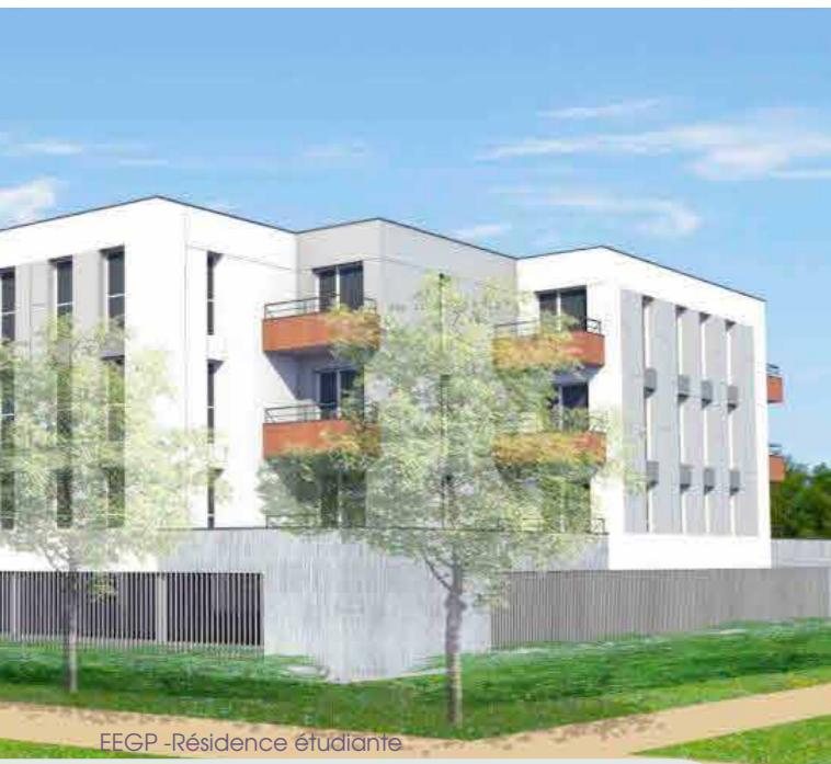
EEGP -Résidence étudiante

Créée en 1984, arrivée à Angers en 1991, l'EEGP a connu deux déménagements successifs vers le CFA Cointreau puis le Centre Soulez Larrivière. Ce nouveau transfert va permettre aux élèves de bénéficier de locaux neufs et plus spacieux. Des partenariats pédagogiques avec le Lycée Saint Aubin La Salle vont être créés, notamment en apportant des compétences en création et design aux filières technologiques ST2D, ainsi qu'en partageant des enseignements en arts appliqués. Avec son ancrage local et son ambition nationale, l'EEGP va devenir un des fers de lance de notre territoire. Par ailleurs, une nouvelle résidence étudiante de 45 logements va accompagner la venue de cette nouvelle école.