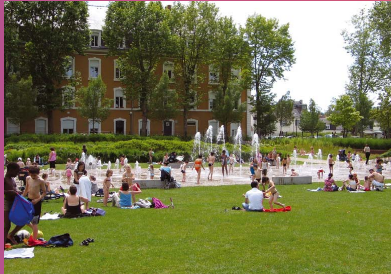
LE MANS > PARC THÉODORE MONOD